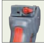
Einstellen der Breite am Justierhebel