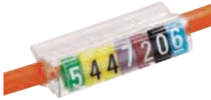
Zeichenhalter 379 38 bestückt mit Kennzeichen: 378 05 + 2 x 378 06 + 378 01 + 378 10 + 378 09 + 378 08