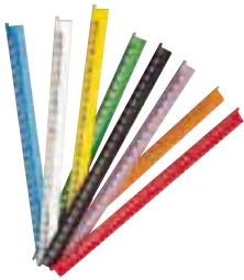
378 01 – 378 10