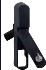
Handgriff Best.Nr. 368 28 für Atlantic