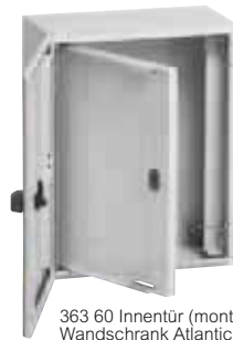
363 60 Innentür (montiert in Wandschrank Atlantic 354 32)