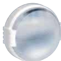
624 25 + 624 49