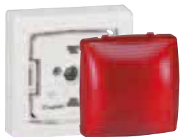
860 49 + 861 83