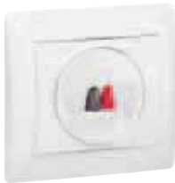
7757 85+7710 01+7710 00