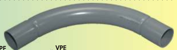
SB 40 GR

Auslieferung nur in Verpackungseinheiten!