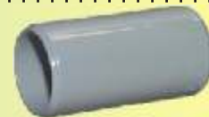
SM 32 GR