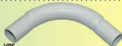
SB 16 HGR