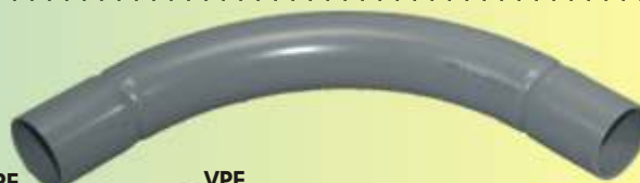
SB 40 GR

Auslieferung nur in Verpackungseinheiten!