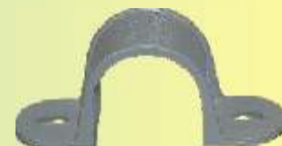
S 40 GR

2-lappig, zur Montage für Schrauben mit 4 mm Ø.