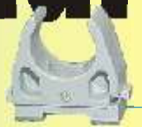
FIS 16 IEC