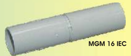
MGM 16 IEC

Konform den Normen CEI 238/III, IMQ-geprüft!