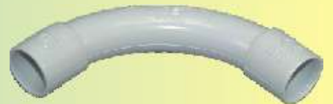
CGRI 16 IEC

RAL 7035, in PVC, nach den Normen CEI 23-8/III, IMQ-geprüft!