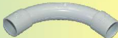
CGRI 16 IEC

RAL 7035, in PVC, nach den Normen CEI 23-8/III, IMQ-geprüft!