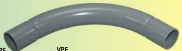
SB 40 GR

Auslieferung nur in Verpackungseinheiten!