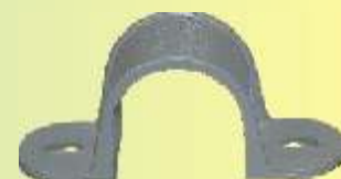
S 40 GR

2-lappig, zur Montage für Schrauben mit 4 mm Ø.