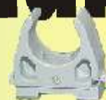
FIS 16 IEC