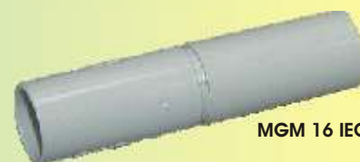
MGM 16 IEC

Konform den Normen CEI 238/III, IMQ-geprüft!