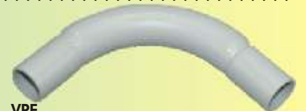
SB 16 HGR