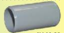
SM 32 GR