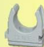
CL 16 HGR

anreihbar, zur Montage für Schrauben mit 5 mm Ø. Größe 16 - 40 halogenfrei