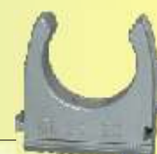
CL 25 GR

anreihbar, zur Montage für Schrauben mit 5 mm Ø. Größe 20 - 40 halogenfrei