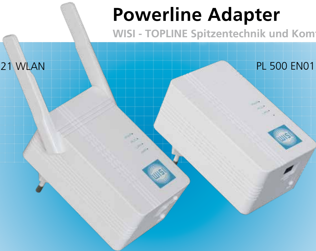
PL 500 EN01

WISI Powerline Adapter machen Ihre Stromleitung zum superschnellen Netzwerkkabel und jede Steckdose zum WLAN.